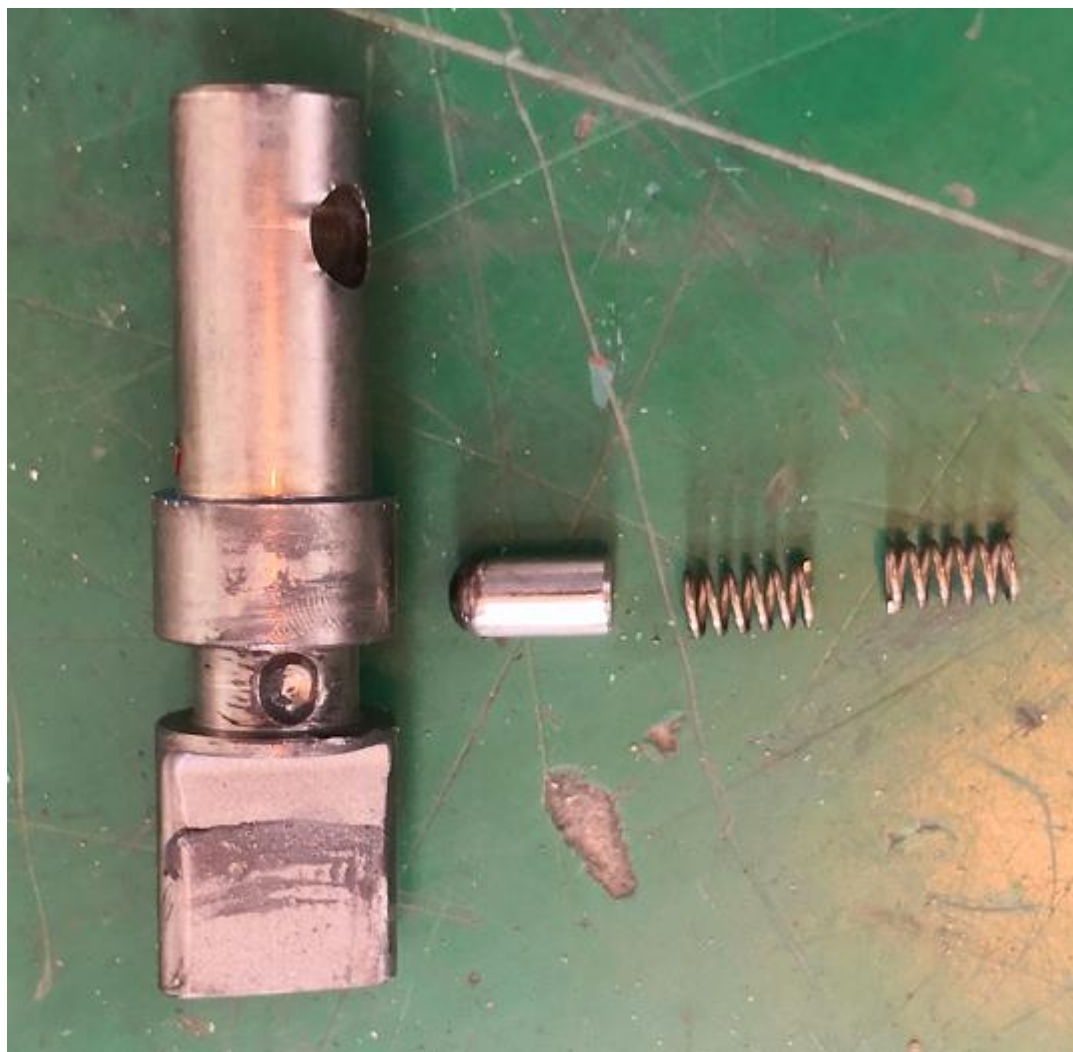
松闸顶杆及定位装置（两个弹簧）