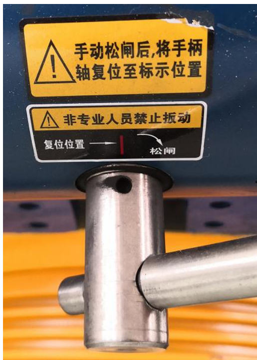
手动松闸装置操作复位说明标签